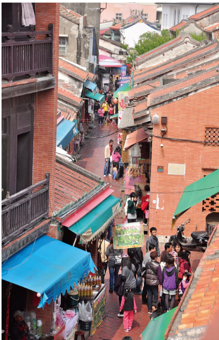
▲古意盎然又具現代化的鹿港獲選為「10大觀光小城」實至名歸。