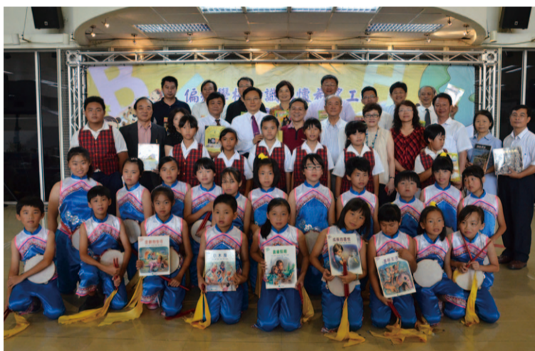
▲中華知識經濟文化發展關懷協會、雙月會及熱心公益人士，捐贈近5,000本書給本縣偏遠學校。