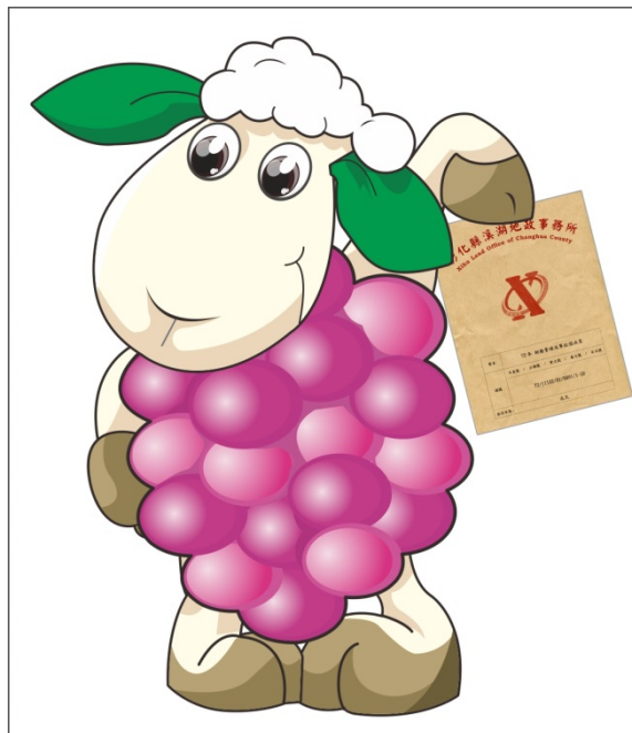
▲設計金檔吉祥物「羊葡寶寶」

八、設計金檔吉祥物「羊葡寶寶」，以親切造型貼近民眾協助推廣各項檔案應用，創造更多的附加價值。