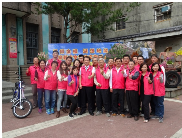
▲舉辦「穿越古今地政文物展」

九、舉辦「穿越古今地政文物展」，拉近檔案與民眾之距離，進一步推廣檔案應用及檔案加值效益。