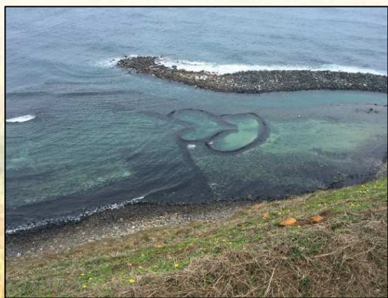
圖 3. 雙心石滬