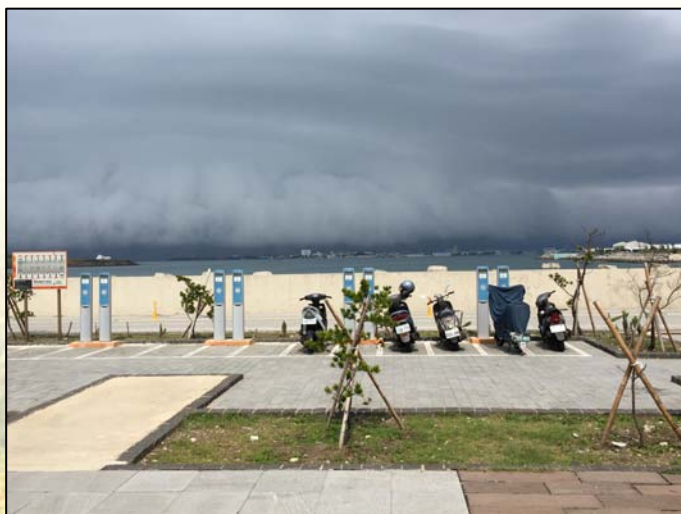
圖 7. 澎湖變天前徵兆

過完9天年假，南來北往從平日忙碌的工作中抽離，南來北往又投入另一種吃吃喝喝的忙碌中，平常少見的親友相聚、叔伯們返鄉祭祖、探望父母，隨著假期結束又各自回到工作崗位；在連假中安排這趟小旅行讓自己放鬆一下，以面對未來一年的挑戰。