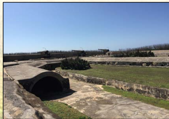
圖 6. 西嶼西臺鳥瞰圖