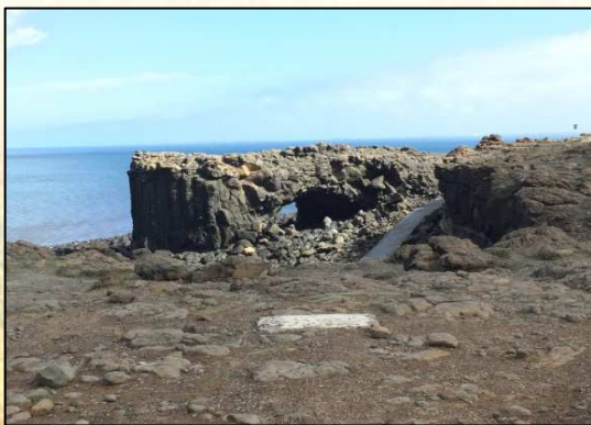
圖 5. 鯨魚洞

武岩。特殊的柱狀玄武岩是澎湖群島特有地質，柱狀玄武岩在海崖上因海蝕作用形成一個大洞，形狀類似鯨魚而名鯨魚洞；在車程約半個小時來到西嶼西臺又稱西嶼古堡，這是在澎湖惟二有收取門票的地方，且已被列為國定古蹟，該古堡是清光緒年間為防禦海寇興建的十座砲台之一，也是台灣少數保存完整的古砲台，從砲台上方鳥瞰整個陣地相當壯觀，可謂是澎湖地區少見的歷史人文景觀。在馬公島上我們又陸續遊覽了幾個景點，像是在林投公園的沙灘上逐浪、參拜古老的媽祖廟，還有造訪已故歌手張雨生、潘安邦小時候居住過的眷村，看到了「外婆的澎