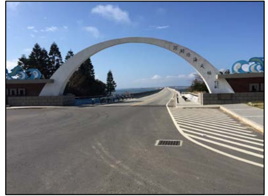
圖 4. 澎湖跨海大橋

第二天回到了馬公開車北行前往西嶼島（漁翁島），白沙島與西嶼島間交通是由著名的澎湖跨海大橋連接，他於1970年興建完成，全長約2600公尺，是台灣最長的橋。過了澎湖跨海大橋到鯨魚洞，屬柱狀玄