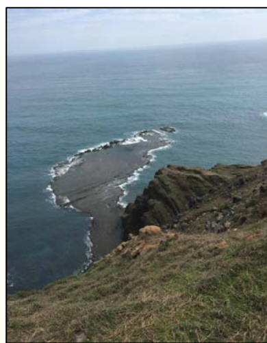
圖 2. 小台灣

出租車大哥說是個適合搭船的天氣，船在風浪不大的海象當中航行了 2 個小時終於抵達七美島。七美島位於澎湖最南邊的小島，島上有許多重要景點，其中又以小台灣、雙心石滬最為出名，在岸上向下遠眺小台灣還真是與台灣地圖極為相似，不禁讓人敬佩大自然的鬼斧神工；雙心石滬則是漁民利用潮汐讓魚群順著海水進入石滬內覓食，退潮後石堤高於海面阻擋魚洄游被困於滬內，漁民便藉此捕捉魚貨，是一種人與大海相互依存的捕魚方法。