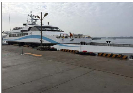
圖 1. 澎湖載運乘客及物資之交通船

利用春節連假最後三天造訪澎湖，一下飛機剛好趕上 9:30 馬公開往七美島的交通船，馬公行船一天往返只有一船班，除了載運乘客外，也是離島補給資源的重要交通工具，冬天的澎湖難得的豔陽天，