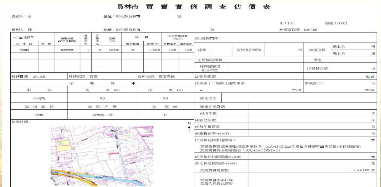
圖 2. 早期買賣實例調查估價表及略圖

2、利用國土測繪圖資網路地圖服務繪製之位置略圖色彩鮮豔，標示地號明顯醒目、面積與形狀均能完整展現，周遭環境一目了然。