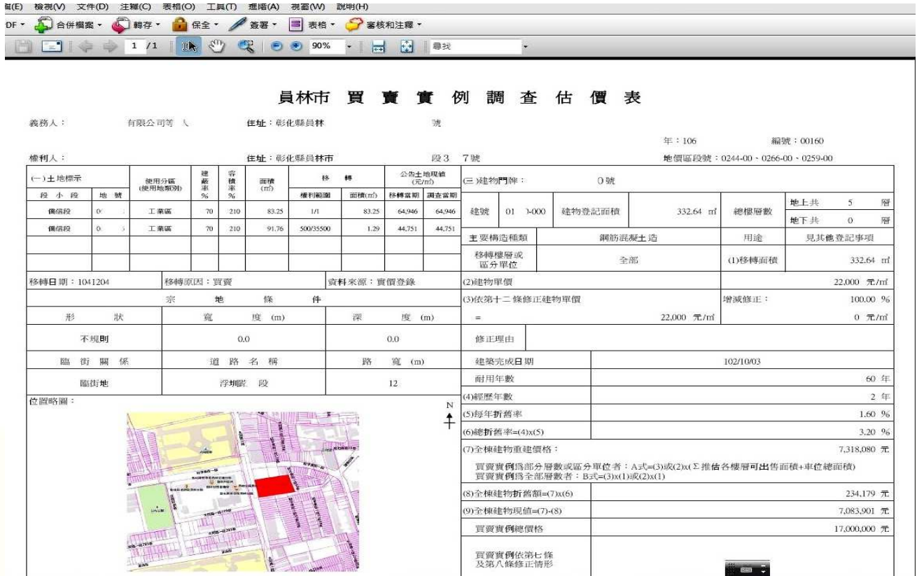
圖 7. 完成買賣略圖後之調查估價表