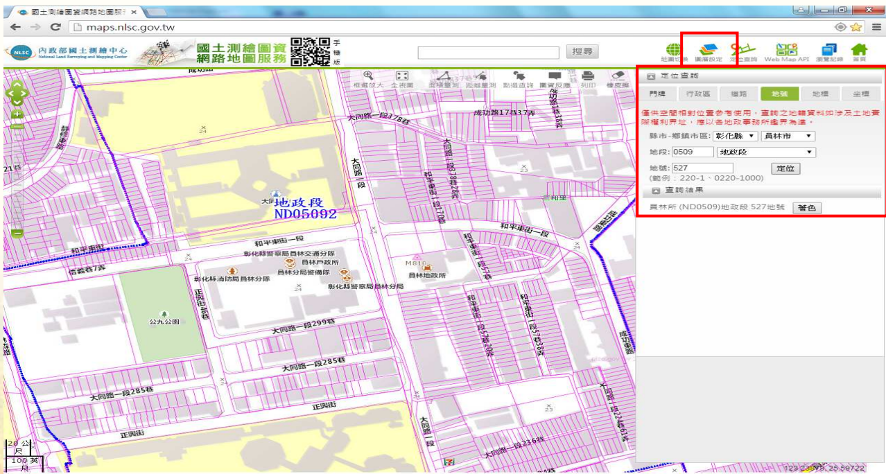
圖 4. 網址右上方輸入地段地號及設定圖層顯示