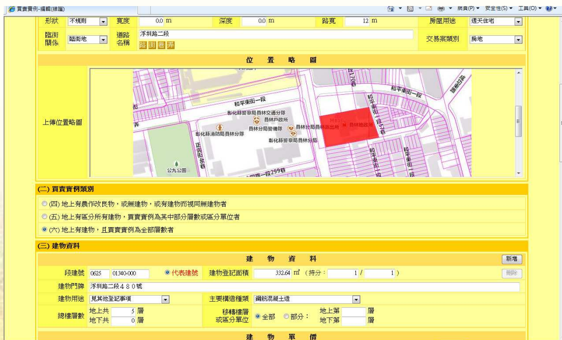
圖 5.、圖 6. 於買賣實例調查表作業系統上傳截圖畫面