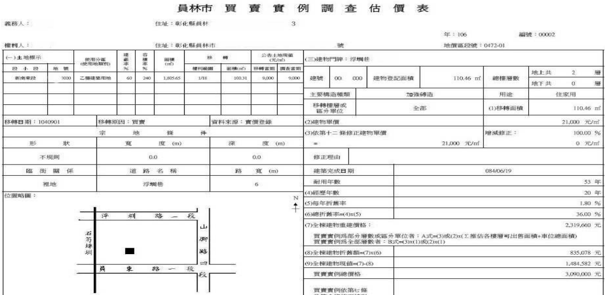
圖 1. 早期買賣實例調查估價表及略圖

1、早期位置略圖：線條簡單，只能表現出簡單位置，無法充分表達面積大小、形狀、實際位置與周遭環境。