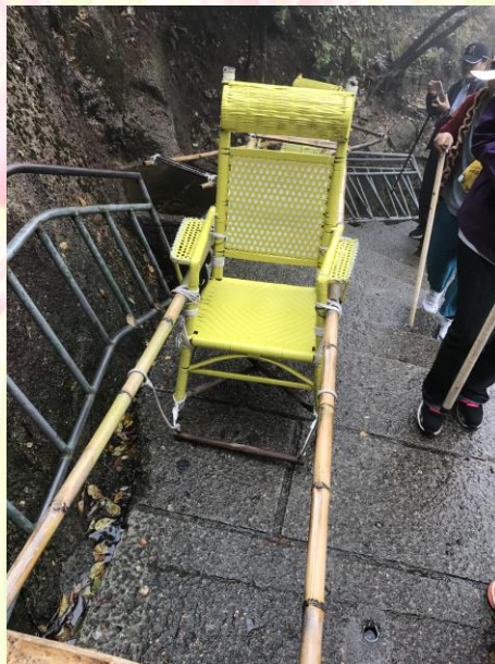
圖七 黃山提供坐轎遊山服務

三天兩夜的黃山深度遊歷後心得，建議遊黃山最好跟團前往，因黃山範圍有1200平方公里，其山路極為複雜遙遠若非有專業導遊帶領，容易在山中迷路或是時間掌握不當導致無法順利抵達飯店，在山內並無路燈山高險峻夜走黃山是相當危險；另外需要評估自己的體力，黃山是不走回頭路的，在山裡一切要靠雙腳，所以建議欲遊黃山者需視體力情況再行前往，不過當地亦有販賣登山杖及提供坐轎遊山的貼心之服務。