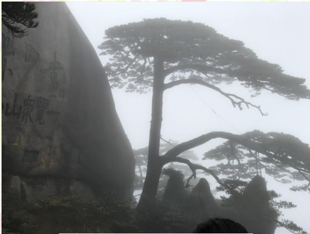
圖一 迎客松(當日濃霧)

抵達黃山後我們從前山的玉屏索道搭乘纜車上山後，一路徒行到玉屏樓景區，在玉屏樓左側見到了黃山之奇松代表「迎客松」，迎客松對登山遊覽的訪客伸展它的手臂表示歡迎，姿態雍容優美，它也是黃山十大名松之首。樓後方是玉屏峰，峰頂是著名的「玉屏臥佛」峰石上有毛澤東草書的「江山如此多嬌」；可惜山上當天霧氣籠罩不能近距離看清楚。