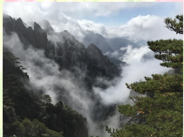
圖五、六 黃山四絕—雲海