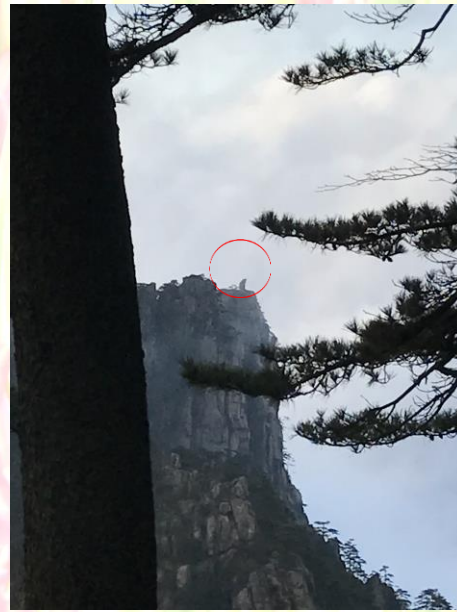
圖四 猴子望太平(紅圈為猴子)

雲海也是黃山另外一絕，黃山雲海雲來霧去，變化莫測，在雲霧裡的群峰有如一片汪洋裡的座座島嶼，時風平浪靜、時而波濤洶湧，甚是好看；黃山地名亦因此而有西海、東海、北海、南海，天海等景區之分。