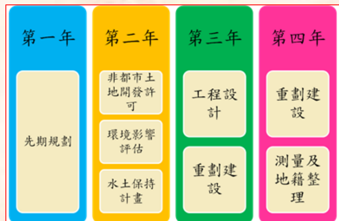
農村社區土地重劃作業項目及辦理程序

農村社區土地重劃係分年辦理先期規劃、非都市土地開發許可、工程設計、重劃建設、測量及地籍整理等 5 項作業，完成重劃作業約需 4~5 年。(詳如右圖)