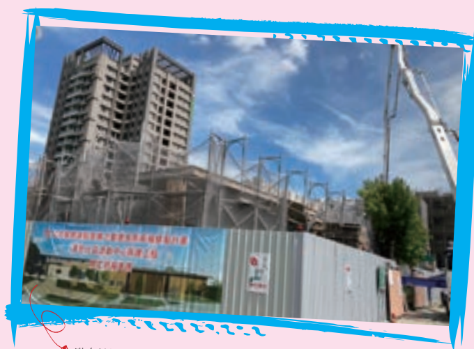
溝皂社區活動中心新建中，期許完工後成為里民的休憩場域。

員林市目前已進入高齡化社會（65歲以上人口比例達到16.9%），因應政府推動長照2.0相關政策，游振雄市長考量各里社區活動中心容量不足，無多餘空間以利設置社區關懷據點或日間照顧中心，因此著手積極規劃推動一里一活動中心，希望能藉由社區活動空間的建立，凝聚在地居民生活、育樂及地方政策推行。