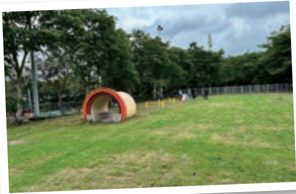
諾大的草皮，是毛小孩放電的好所在！

彰化第一座寵物公園正式啟用！位於員林運動公園西側原閒置槌球場空地，占地面積約 7,950 平方公尺做為兒童與寵物遊憩場所，其中寵物公園規劃以大片草坪讓寵物自由奔跑，另為防止發生意外於四周設置安全圍籬提供安全活動空間，並設置輪胎圈、跳躍跨欄、爬坡等設施打造毛小孩的遊樂天堂，另外 2 處兒童公園設置 2 座全新磨石子溜滑梯與盪鞦韆及攀岩遊具等，以新穎遊具吸引小朋友們遊玩。