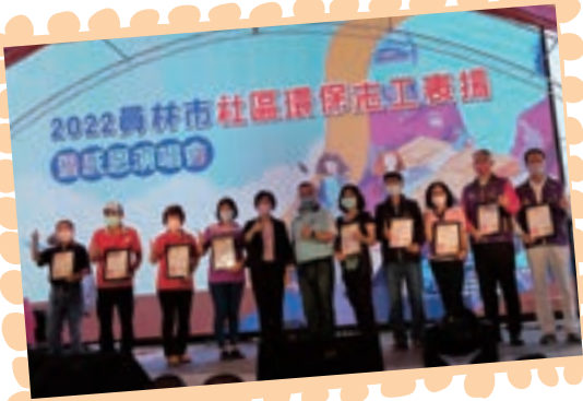
王縣長、游市長與環保志工合影。

員林市公所為感謝環保志工無私奉獻，長期用心投入社區服務及為環境所付出的辛勞，特別於5月14日辦理表揚活動暨感恩演唱會。表揚活動中由縣長王惠美頒發彰化縣110年度環境清潔考核第一組特優第一名及資