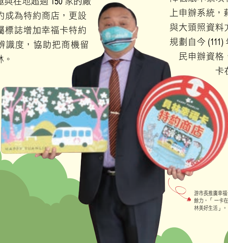
游市長推廣幸福卡不遺餘力，「一卡在手 員林美好生活」。

此外，為增進市民朋友申辦的便利性、降低紙本繁瑣程序，於今年3月1日啟用線上申辦系統，藉由免繳交實體身分證明文件與大頭照資料方式，提高市民申辦意願，並規劃自今(111)年7月1日起開放六歲以下市民申辦資格，邁向不限年齡皆可享有「一卡在手、幸福員林帶著走」的美好生活目標。