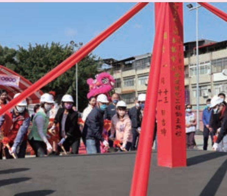
王惠美縣長與游振雄市長出席動土典禮，讓員林更進步！

由市公所自籌經費1,600萬元的東區「大峯社區活動中心」，歷經多年的土地撥用、水土保持工程及建照取得等前置籌備作業後，終於在110年9月完工落成，提供里民社區照顧與完善的交流空間。此外，市公所亦積極爭取衛生福利部前瞻計畫，108年為補足北區活動中心比重失衡，優先規劃興建「三和社區活動中心」，並結合縣府地下停車場及公園美化工程於111年1月動土；109年再次爭取中央補助經費，於南區公15公園規劃社區活動中心，而歷經多年覓地、建築成本飆漲之下，預計今(111)年底前嶄新的「溝皂社區活動中心」將與市民朋友見面。