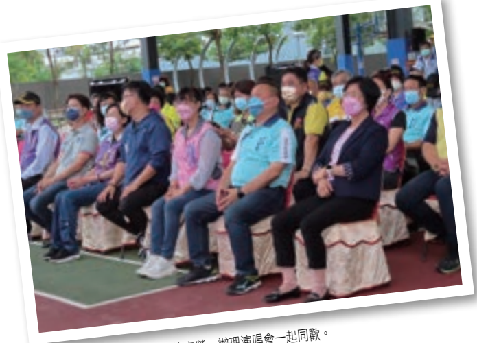
市公所感謝環保志工的辛勞，辦理演唱會一起同歡。