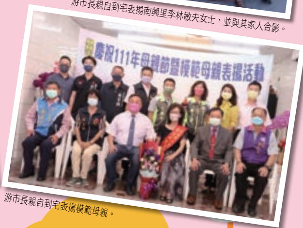
游市長親自到宅表揚模範母親。