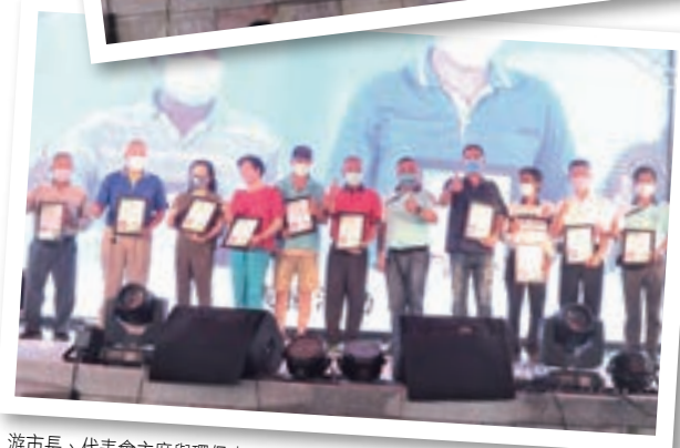
游市長、代表會主席與環保志工合影。