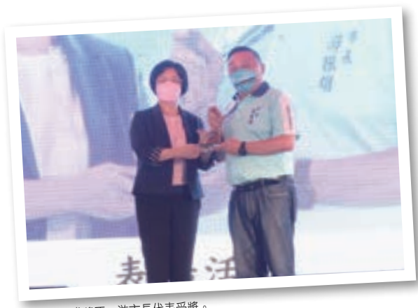
王縣長頒發獎盃，游市長代表受獎。

也因為有這些默默為社會付出的無名英雄，員林才能多次在考核中榮獲佳績，期盼更多社區能群起效仿，加入空品淨化區維護認養工作，更歡迎在地鄉親以實際行動一起支持、守護我們的故鄉，與市公所共創「幸福員林、美麗城市」。