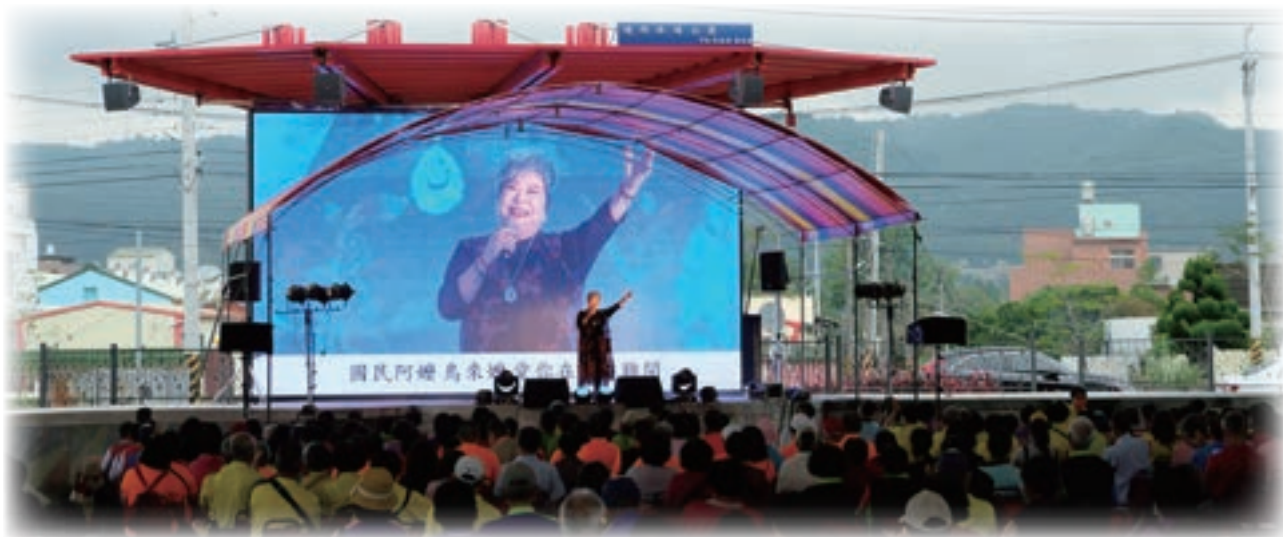
演唱會邀請歌手與大家同樂。

游市長表示，員林市的環境衛生需要所有市民共同來維護，市內公共區域平日除了由清潔隊負責打掃、清消外，由 30 個社區所成立的環保志工隊約 2,000 位志工，犧牲假日睡眠時間一大早打掃社區周圍環境，市公所感謝志工隊夥伴們的無私奉獻及為環境付出的辛勞，以實際行動打造更美好的生活環境，