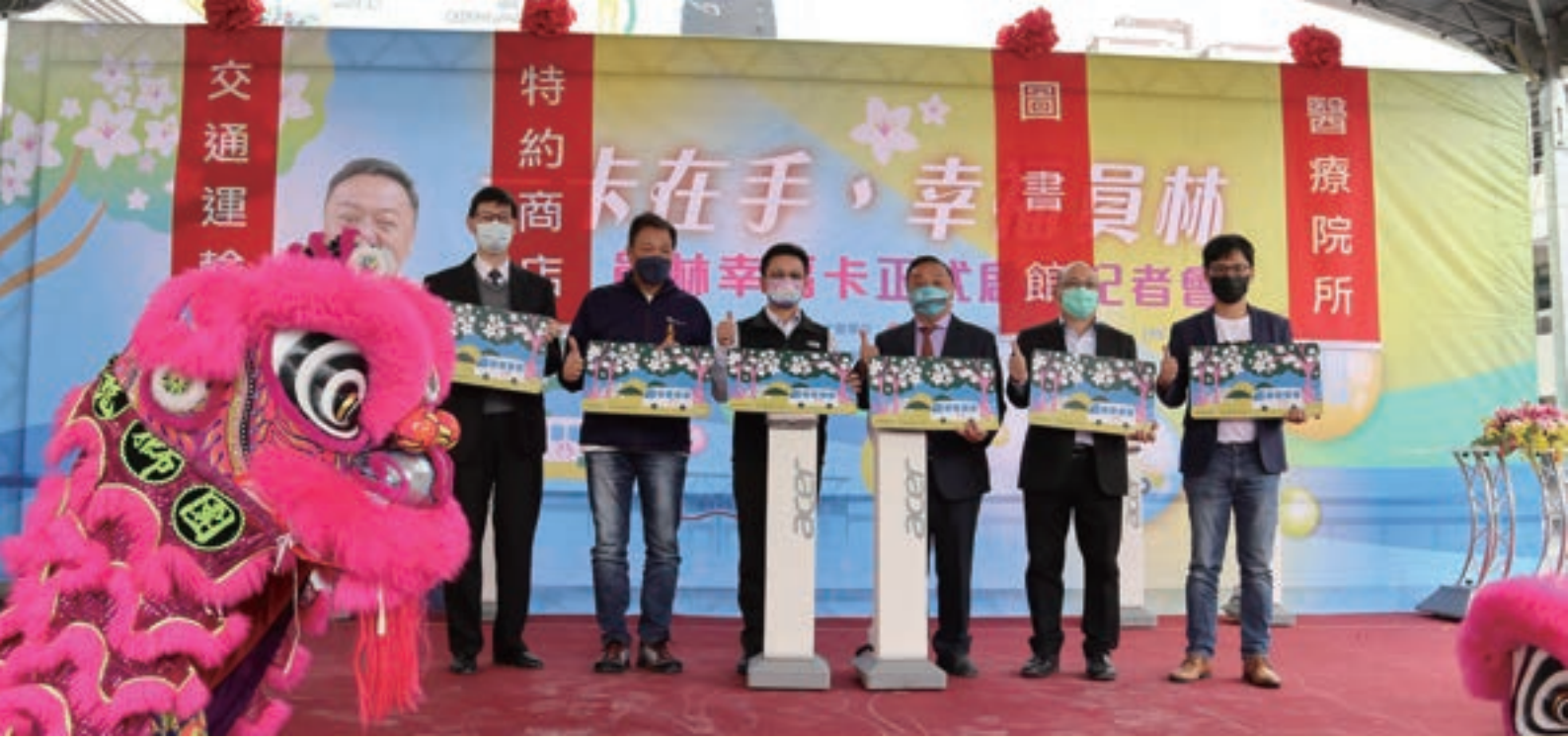
交通運輸、特約商店及圖書館等，一張幸福卡即可暢遊員林。