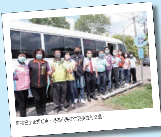
幸福巴士正式通車，將為市民提供更便捷的交通。

幸福巴士持員林幸福卡即可免費搭乘成為員林市民專屬限定福利，目前營運路線深入東區、西區及南區各里，各站運行時間附牌已完成吊掛，市民查詢路線可掃描附牌QR-code或至市公所網站查詢，未來亦聽取各方意見，期望在有限資源下，能夠照顧到所有人，依據不同的族群，規劃更合適的路線、提升營運服務品質。