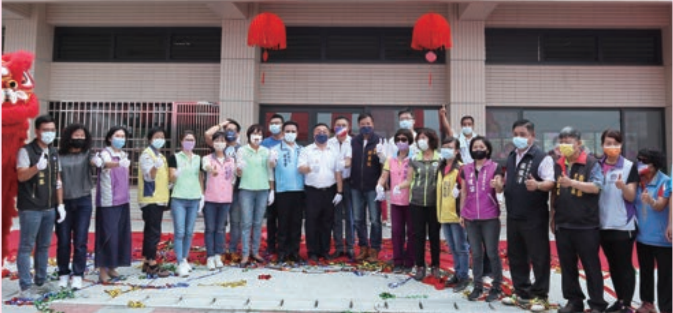
大峯社區活動中心完工，現為里民社區照顧與完善的交流空間。

除自辦興建工程外，市公所也尋求與中央機關合作的可能性，西區南興里因預定興建用地與營建署規劃的社會住宅用地重疊，經多次的會議溝通與爭取，110年底與國家住宅及都市更新中心簽訂「南興安居社會住宅參建活動中心合作意向書」，借重住宅及都市更新中心的專業規劃與興建能力打造出舒適的「南興社區活動中心」；同時亦以相同的合作模式爭取參建住都中心於北區仁美里的「靜修好室」社會住宅新建工程，規劃案件於今年5月上網招標，期待盡快能提供「仁美社區活動中心」予市民朋友。