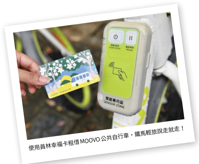
使用員林幸福卡租借 MOOVO 公共自行車，鐵馬輕旅說走就走！

約商店，便民又能促進市區消費，真是很棒的政策。」目前育有二子的王小姐分享，員林市公所推出具身份辨識及行動支付功能的「員林幸福卡」，設籍於員林的鄉親，不限年齡皆可申辦，還附加600元的開卡禮。王小姐一家四口就領取