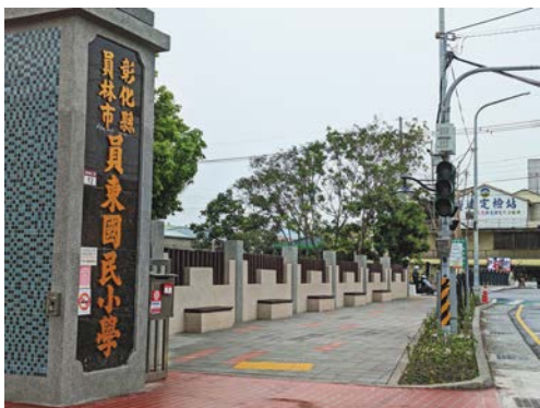
市公所於員東國小周邊，增設友善安全的通學步道。

除了課程，市公所也致力於提升校園軟、硬體設備，務求讓學童擁有優質的學習環境。員東國小與東山國小，周邊舊有人行道崎嶇、破損。為提升學童的通學安全，於員東國小門口及校園兩側及東山國小山腳路旁，興建通學步道，讓學童上下學及家長接送能有更舒適、安全的環境。