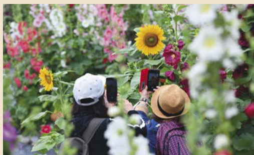
把握難得的機會，享受漫步蜀葵花田間的美好時光。

日復一日的繁忙生活，不免讓人感到困頓疲乏。找個假期，為自己安排一趟知性藝文之旅，陶冶身心吧！員林有哪些值得造訪的藝文場域或活動呢？一起來走走看看吧！