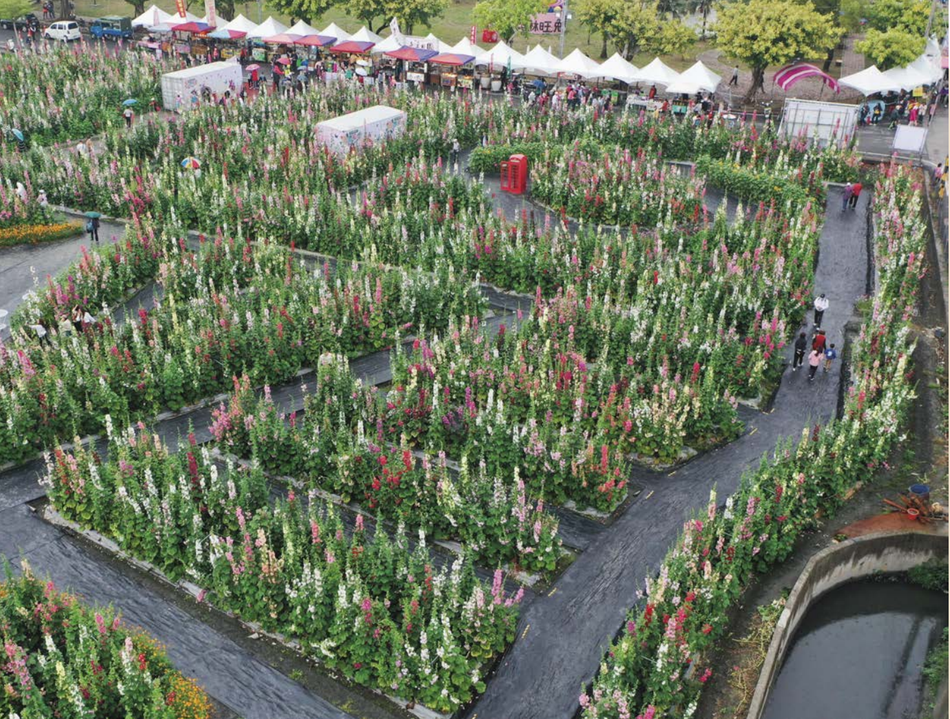
盛開的蜀葵花田，萬紫千紅的景色令人陶醉。