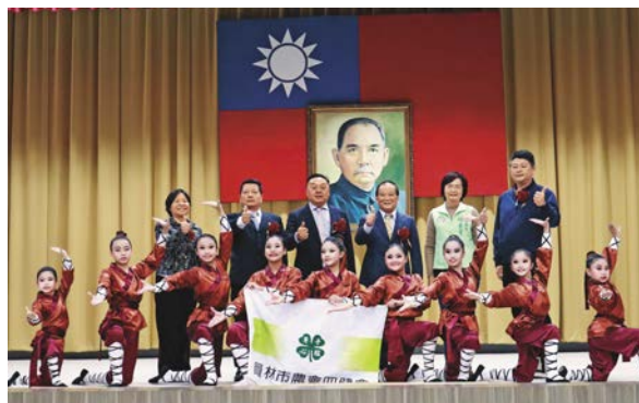
游市長出席112年農民節表揚大會。