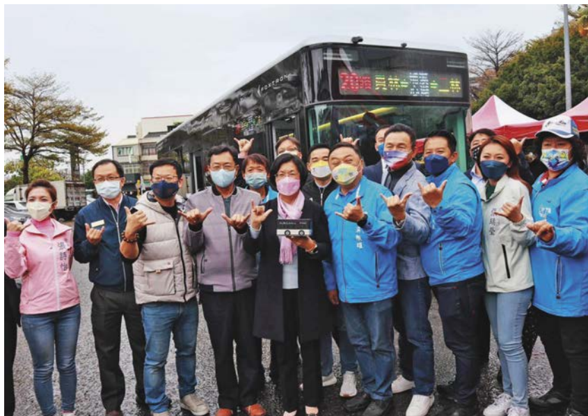
今年起彰化第一部電動公車【20路】正式上路。