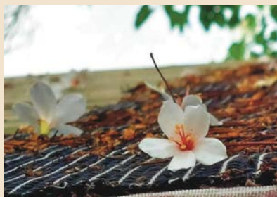
看見油桐花，令人聯想體現惜福、感恩精神的客家文化。