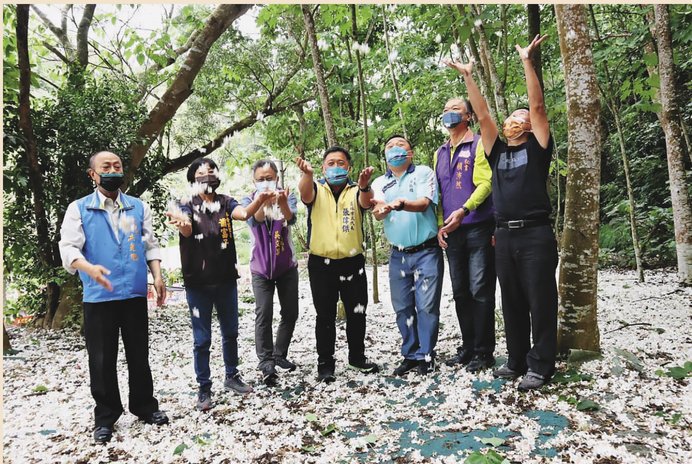
當油桐花在藤山步道盛開時，掉落的花瓣形成美麗的雪白花毯。

若是偏好簡約、優雅類型的花朵，那就不能錯過尋訪員林的山林之雪——油桐花。約莫於每年4、5月盛開的油桐花，當那花瓣落在員林知名的藤山步道上時，會形成一片雪白花毯，十分夢幻，吸引大批遊客一睹芳容。