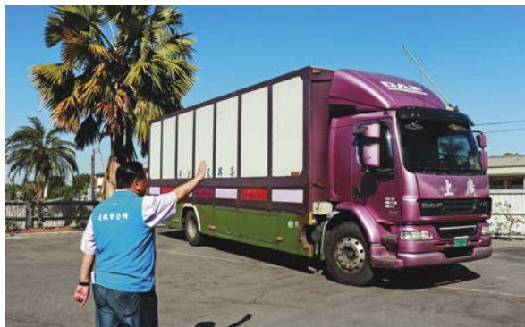
社頭鄉上廣貨運全額贊助貨櫃車運費，將賑災物資送往台北指定倉庫。

在市公所的安排下，由社頭鄉上廣貨運全額贊助貨櫃車運費，即時在台北土耳其貿易辦事處結束募集專案前，將112箱發熱衣、棉襪、圍巾等禦寒物資送往台北指定倉庫。「希望能將台灣人的溫情送達土耳其，幫助他們盡速重建家園。」張執行長說。