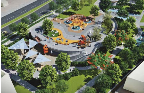
設有兒童遊戲區及樂齡體健設施的「公14公園」，為員林再增一座全齡化遊憩區。

「許多長輩外出，若無合適的交通工具，就需要配合家人的時間載送。」游市長表示，建置幸福巴士的主因之一，即為提升公共運輸量能，結合MOOVO公共自行車，讓更多無車族暢行全城。今年起彰化第一部電動公車——市區客運【20路】「員林-二林(經溪湖)」也已正式上路，