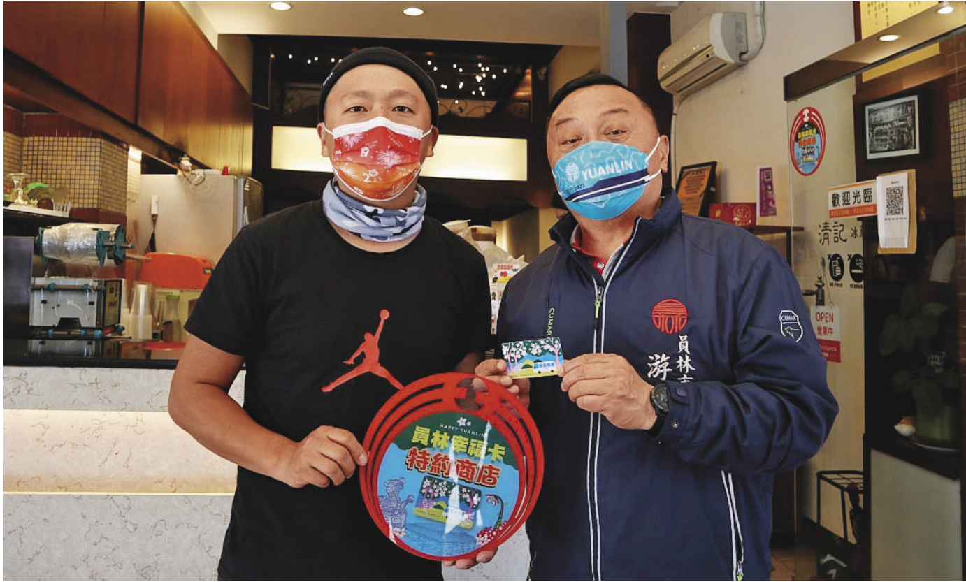
員林幸福卡串聯百間以上特約商店，讓大家智慧享好康。

員林市發展歷史悠久，走進巷弄街頭，隨處可見填滿故事的古蹟、歷史建築等。城市進化的腳步亦不曾停歇，造就當今員林市新舊共融、充滿活力的街景。