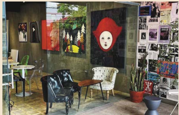
躲咖啡牆上的畫作，出自老闆之手。

從事藝術創作的老闆，兩年前自台北返鄉、回到員林創業。躲咖啡結合了微型展演、生活選物、服飾及咖啡輕食等，皆延續了老闆對美學的感受。「目前店內固定展出我的個人畫作，希望未來能成為更多藝術、音樂創作者揮灑的舞台。」