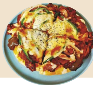
添加微焦起司與鮮紅肉醬的那不勒斯披薩，令人食指大動。