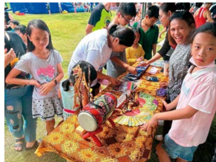
現場設有「趣味異國童玩闖關活動」，促進文化交流。

員林市長游振雄分享，「今年終於擺脫Covid-19疫情的陰霾。員林青商會自年初起就積極和公所討論活動內容，本次特別邀請新住民朋友一起同歡，活動內容精采豐富且寓教於樂，讓大家在沖涼玩水之外，也對潑水節的文化內涵有更深的認識。」