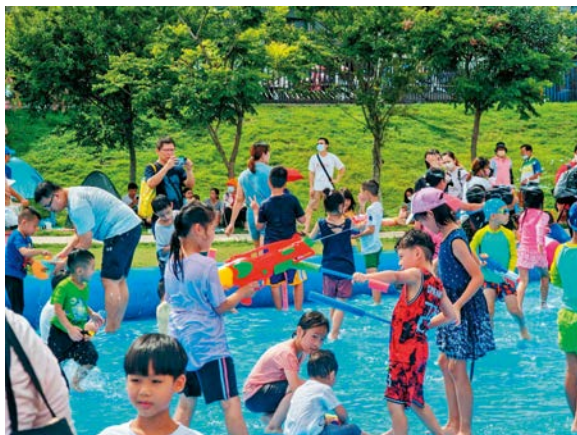
入場遊客可獲得限量免費水槍，讓大小朋友玩水更刺激。

今年員林潑水節現場十分精彩，除了贈送遊客們免費水槍，還準備了大型滑梯、大型泳池供大家暢玩，以及白色泡泡趴等精彩活動。現場也邀請了員榮醫院設立醫護站，提供免費量測血壓與醫護諮詢等，讓大家在安全無虞的場地戲水，玩得更盡興。玩水玩得累了，還可