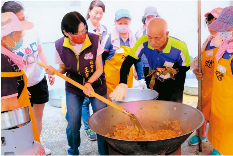
市公所另編列經費補助社區辦理課程、講座及班隊，讓社區長輩們的體驗活動更多元。