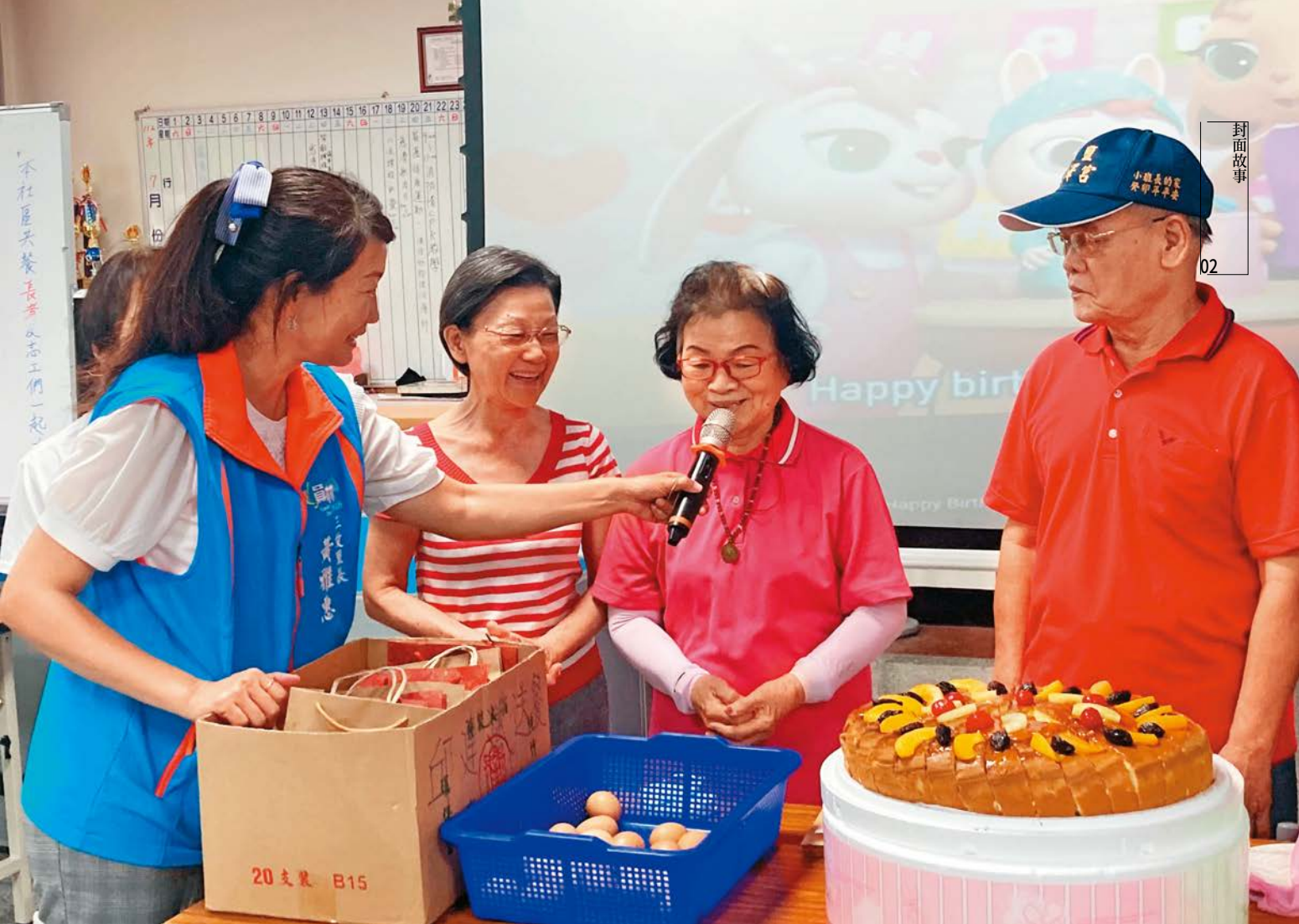
十七份社區發展協會辦理月例慶生會，維繫社區居民間的情誼。