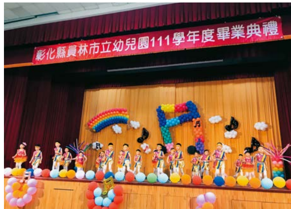
111學年度袋鼠班師生以環保樂器演出「一同鼓舞 遨翔天空」。