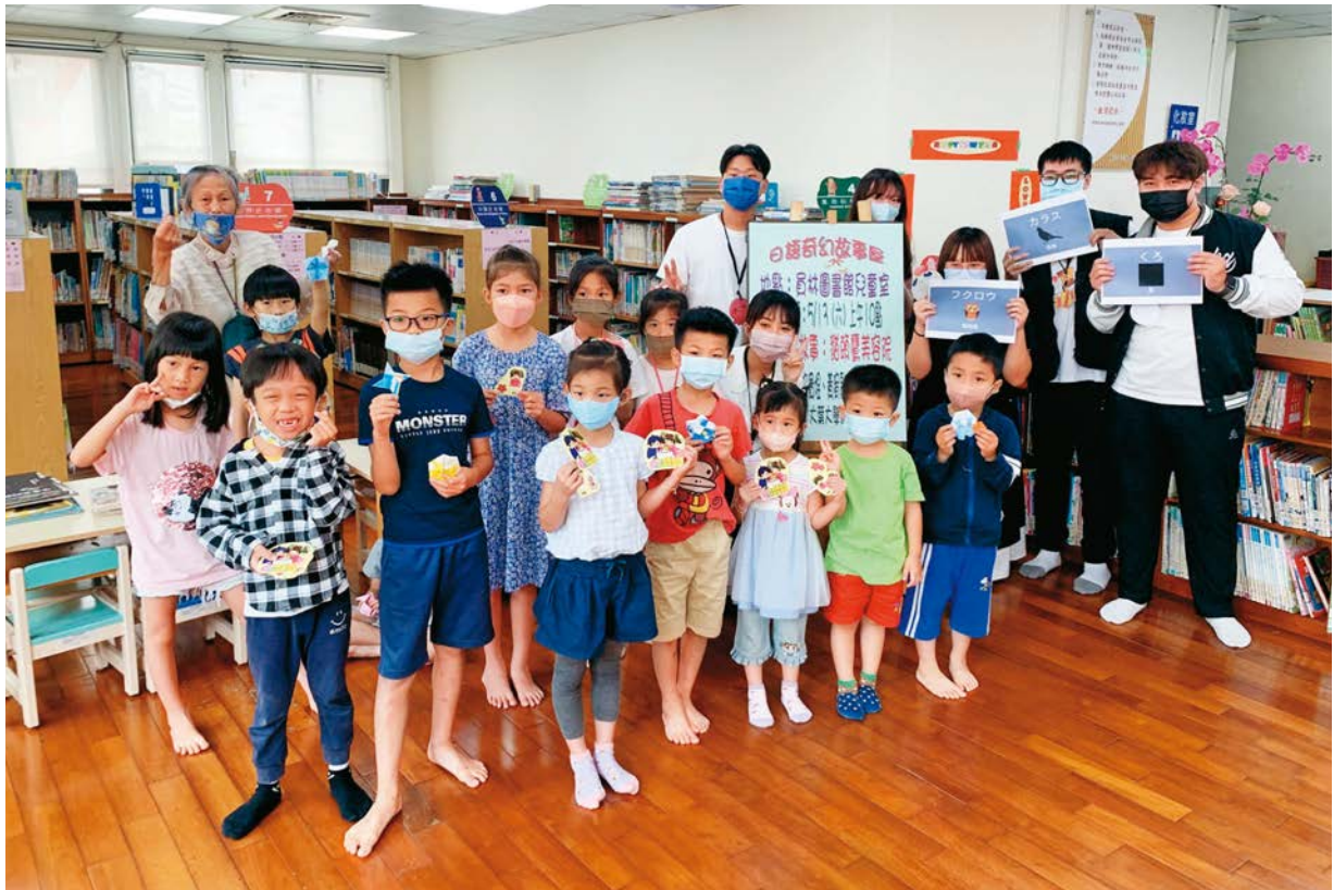
員林市立圖書館邀請大葉大學應用日語學系，為親子讀者帶來生動的說故事活動。

為了讓更多在員林長大的孩子，享有優質學習環境，市公所積極推動如改善員東國小與東山國小通學步道工程等校園軟、硬體設備的優化。一到週日，爸爸、媽媽還可帶著孩子，至員林市立圖書館參加免費的閩南語真趣味、日語奇幻故事屋、徜徉英文繪本奇幻世界等活動，啟發孩子對語言學習的興趣與動機。