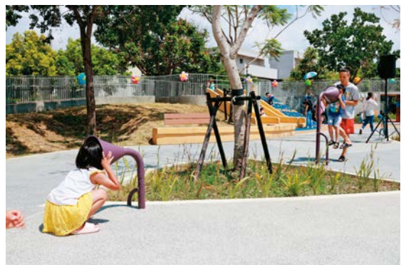
今年迎來啟用的共融式「兔馬鹿公園」。

根據衛生福利部發布之《高齡社會白皮書》表示，預估2036年，台灣將進入老年人口比達28%的極高齡（ultra-aged）國家行列，提供更多公共空間「全齡化」設施已成為趨勢。在員林市，繼寵物友善的員林寵物公園、公19晴雨球場公園，今年第一座共融式「兔馬鹿公園」已於7月啟用，提供市民更多適合全家大小同樂的遊憩空間，也體現市公所打造「無齡化生活環境」的信念。