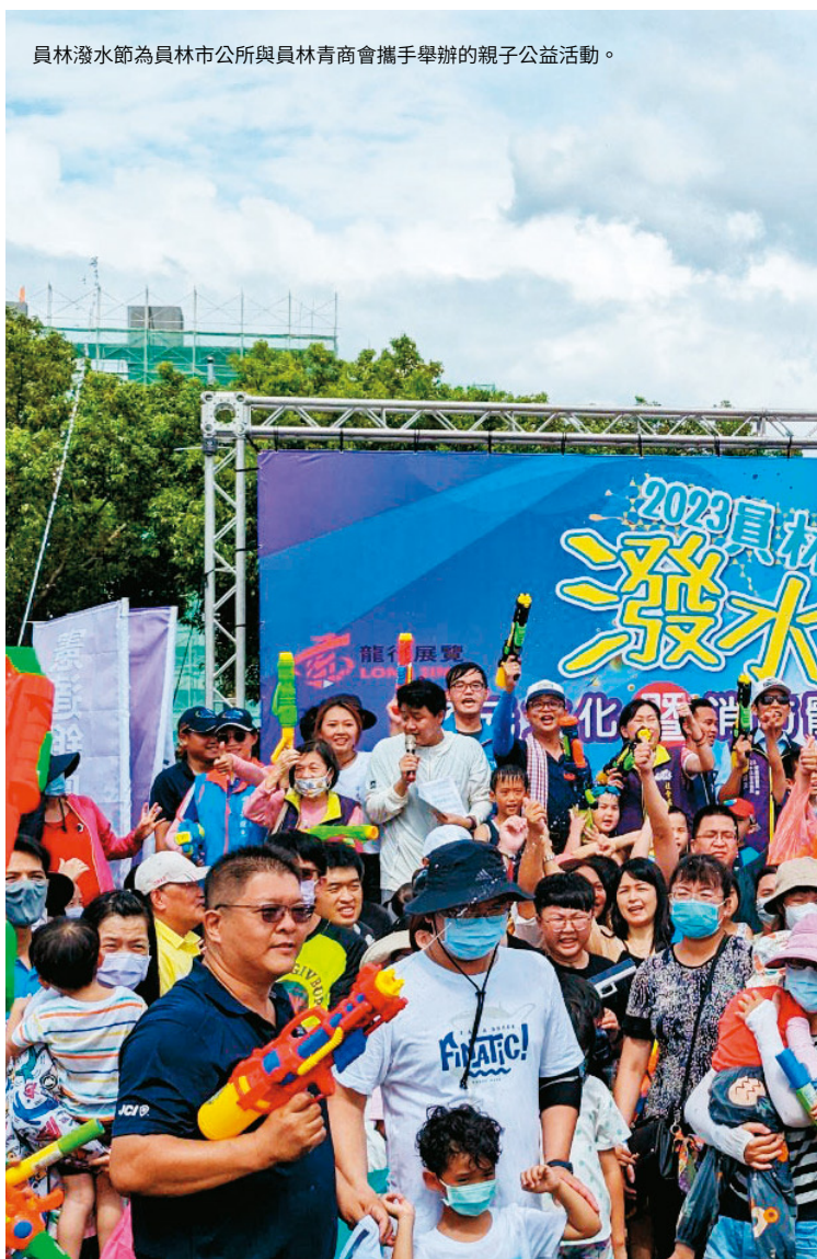
員林潑水節為員林市公所與員林青商會攜手舉辦的親子公益活動。