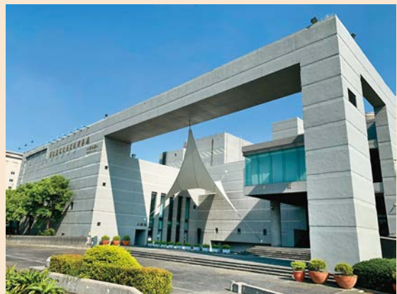
員林演藝廳灰淨簡約的建築外觀，有一象徵夢想向天空展翼的三角帆布，是場館亮眼的特色形象。