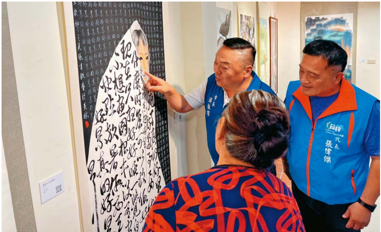
員林市長游振雄親赴「半夜一點半」展覽現場，觀賞員林高中美術班同學們的創作。

今年夏季，在員林市立美術館有許多藝術作品輪番展出，為市民朋友們帶來多采多姿的藝享時光。