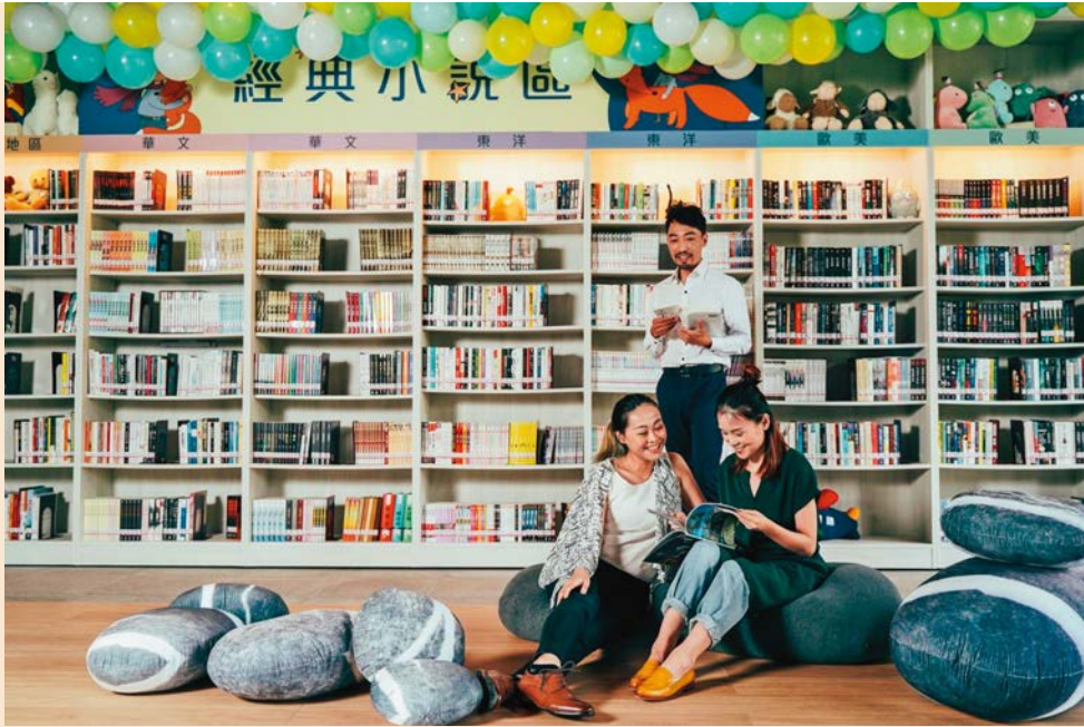
明亮通透的圖書室，提供市民舒適自在的閱讀時光。