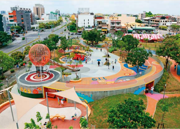
今年7月啟用的兔馬鹿公園設置多款共融式遊具，大小朋友都能同樂。

象的消防車造型遊具「小小消防隊」，則可進入車內、握方向盤，享受模擬駕駛消防車的樂趣。另有歡樂戲沙池、樂齡體健設施以及全齡友善的綠廊帶等，大人、小孩都能在此同享歡樂時光。