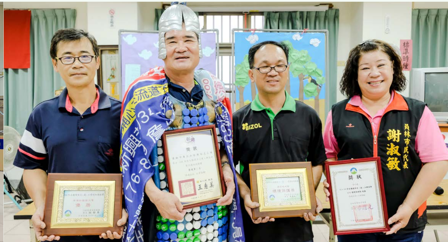
東北社區只要出馬，就一定會得獎，歷年來獲獎無數