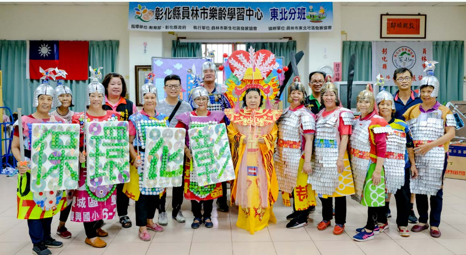
環保志工們組成了一個軍團參與比賽，所有服裝都是環保回收材質手工製成