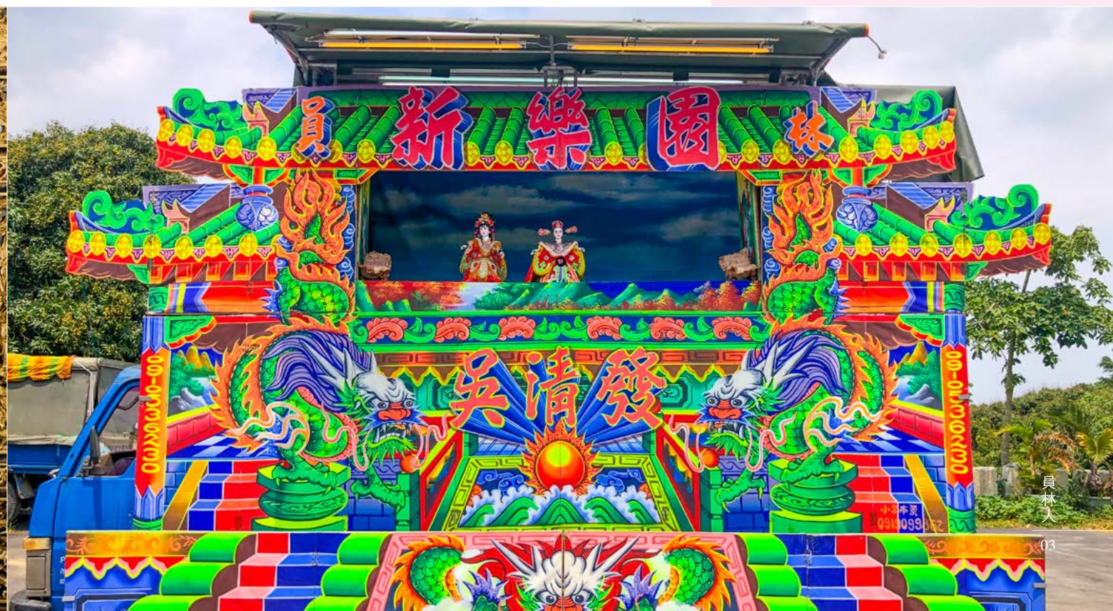
現在的演出，多由一臺小貨車做為舞臺的地基